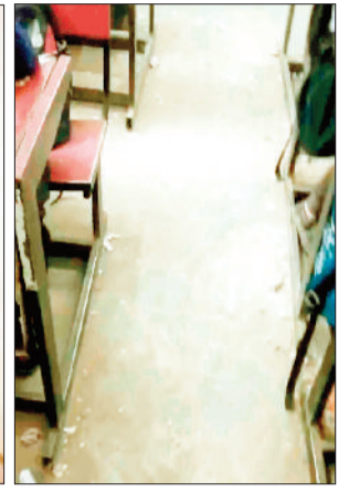
वलासरूप में एकत्र कचरा

आए इसके लिए स्वामी आत्मानंद स्कूल का संचालन किया जा रहा है। विकासखंड प्रतापपुर के डांडकरवां में शासन की उत्कृष्ट विद्यालय स्वामी आत्मानंद इंग्लिश मीडियम स्कूल संचालित है लेकिन स्कूल प्रबंधन की लापरवाही तथा देख रेख के अभाव में स्कूल परिसर कूड़ा करकट में तब्दल हो गया है। यहां तक की साफ सफाई के अभाव में स्कूल परिसर में जगह जगह कचरा है वही कक्षाओं में भी सफाई के अभाव में कचरा बिखरे हुए है। हैरानी की बात तो यह है कि जो छत्तीसगढ़ सरकार के स्टैंडर्ड स्कूलों में गिनती आती है उसकी हालत बहाल है। स्कूल में प्रारंभ से ही भूचल का अभाव है। हालांकि सरकार द्वारा भूचल अटैच किया है लेकिन वह भी नहीं आता। ऐसे में यह कहा जा सकता है कि स्कूल में कोई भूचल है ही नहीं जिससे चपरासी के अभाव में साफ-सफाई नहीं हो पा रही है। नियमित साफ सफाई नहीं होने से स्कूल की हालत दयनीय होती जा रही है। स्थिति यह है कि बच्चे कूड़ा करकट गंदगी के बीच स्कूल में पढ़ाई करने को मजबूर