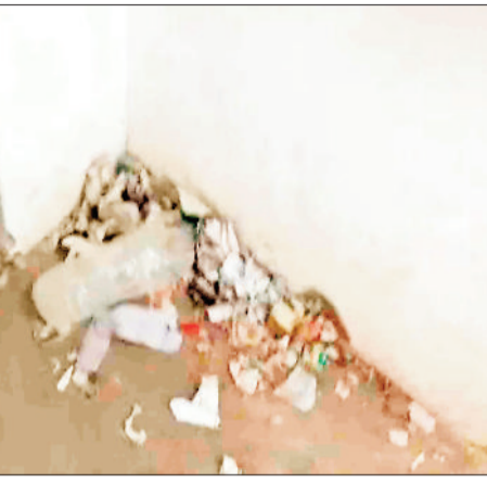
वलासरूप में एकत्र कचरा

शिक्षा को बढ़ावा देने प्रदेश सरकार द्वारा विभिन्न योजनाएं संचालित की जा रही है जिससे बच्चों को बेहतर शिक्षा मिल सके। प्रदेश सरकार द्वारा निजी स्कूल की तरह न सिर्फ व्यवस्था हो बल्कि शिक्षा गुणवत्ता में सुधार